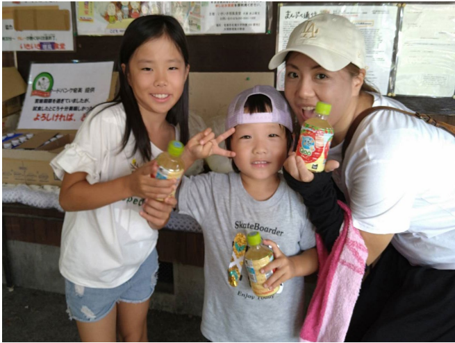
NPO法人フードバンク奄美