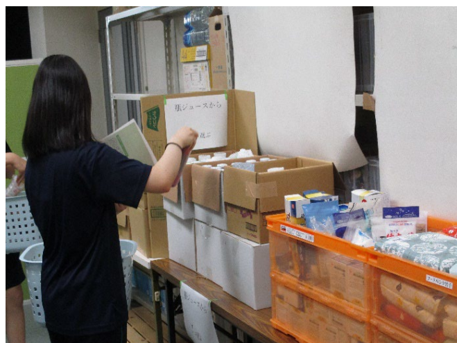
認定特定非営利活動法人フードバンク岩手