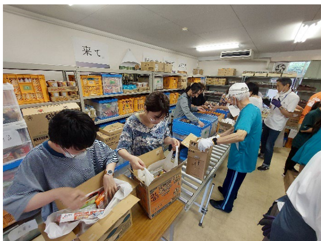
NPO法人フードバンク奈良

フードバンク団体のスタッフやボランティアの皆様をはじめ、たくさんの方々にご協力いただきました。