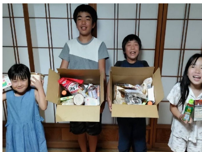
フードバンクそお (財部町身体障害者協議会)