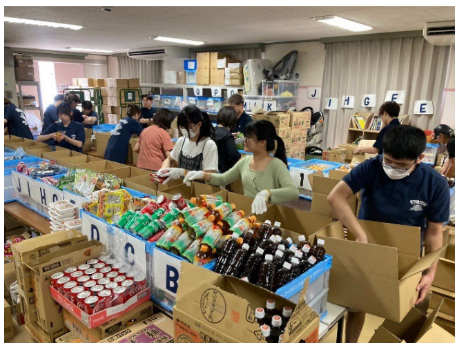
NPO法人フードバンク北九州ライフアゲイン