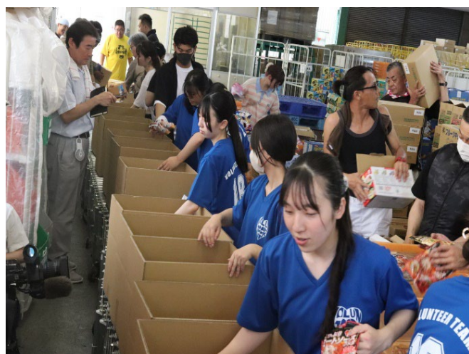
認定NPO法人セカンドハーベスト京都