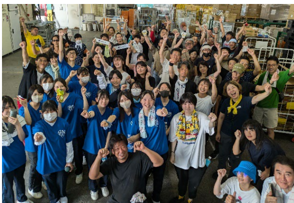
認定NPO法人セカンドハーベスト京都