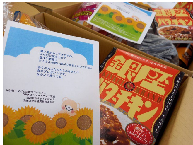
NPO法人フードバンク茨城