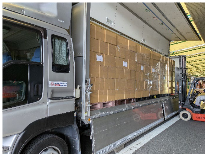
認定NPO法人セカンドハーベスト京都