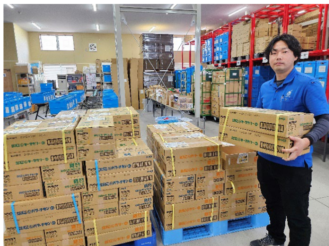
認定NPO法人フードバンク山梨

今回のプロジェクトでも、たくさんの食品を寄贈していただきました。 おかげさまで、41,433世帯に食料を提供することができました。