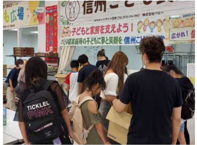
ホットライン信州