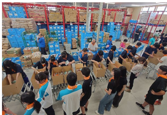
認定NPO法人フードバンク山梨